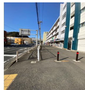
屏風ヶ浦交差点(国道16号線)